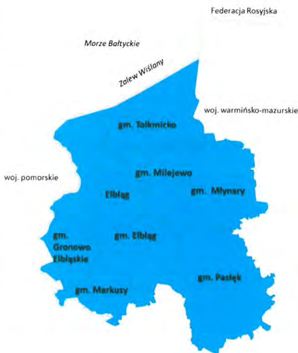
Mapa 1. Obszar MOF Elbląga objęty strategią

Niniejsza Strategia obejmuje swoim zasięgiem mniejszy obszar niż wskazywany w poprzednim dokumencie, co wynika z zasięgu OSI MOF Elbląga wyznaczonego w Strategii Warmińsko-Mazurskie 2030, a jednocześnie jest on szerszy w stosunku do tego, na którym dotychczas realizowane były Zintegrowane Inwestycje Terytorialne w perspektywie UE 2014-2020. Przyjęta w lutym 2020 roku przez Sejmik Województwa Warmińsko-Mazurskiego Strategia Warmińsko-Mazurskie 2030 określiła łącznie dziesięć obszarów strategicznej interwencji, wśród których znajduje się OSI MOF Elbląga. W skład OSI MOF Elbląga wchodzi: miasto Elbląg, gminy miejsko-wiejskie: Młynary, Pasłęk, Tolkmicko oraz gminy wiejskie: Elbląg, Gronowo Elbląskie, Markusy, Milejewo (Mapa 1).