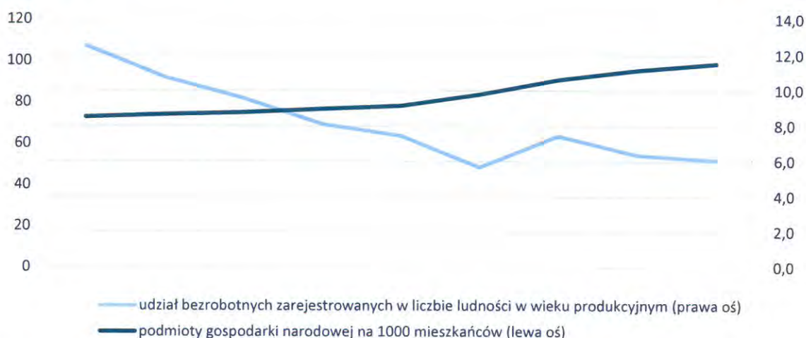
Wykres 2. Podmioty gospodarki narodowej na 1000 mieszkańców oraz bezrobociu w MOF Elbląga w latach 2014-2022

Źródło: opracowanie własne na podstawie danych BDL GUS.