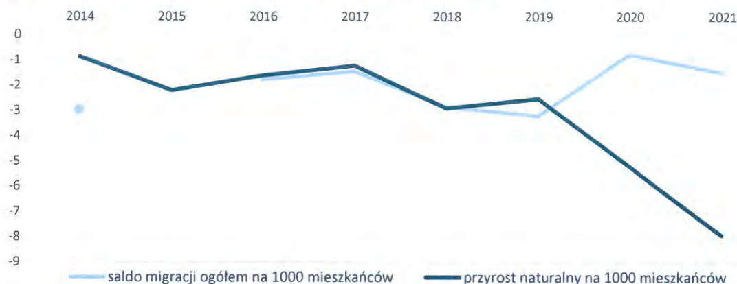
Wykres 1. Procesy demograficzne w MOF Elbląga w latach 2014-2021

Źródło: opracowanie własne na podstawie danych BDL GUS.