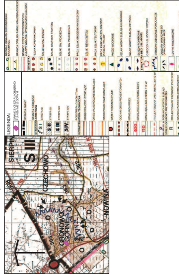
ZMIANA MIEJSCOWEGO PLANU Zagospodarowania Przestrzennego Dla Fragmentu Terenu Obręb Geodezyjnego Gronowo Górne